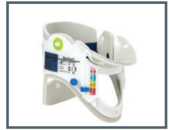
Ambu® Perfit ACE®