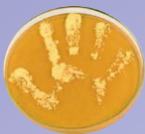
Handabklatsch ohne Seifenwaschung oder Desinfektion

Mit ihrer „Clean Care is Safer Care“-Initiative startete die WHO 2005 eine weltweite Kampagne für mehr Patientensicherheit. Im Mittelpunkt steht die Verbesserung der Händedesinfektion, da diese einen direkten Einfluss auf die Übertragung pathogener Erreger hat. Für dieses Ziel wurde das Konzept der „5 Momente der Händedesinfektion“ entwickelt (1).