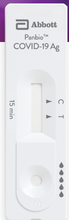
Panbio™ COVID-19 Ag Schnelltestkassette