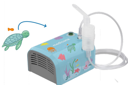
Inklusive Sticker – Set