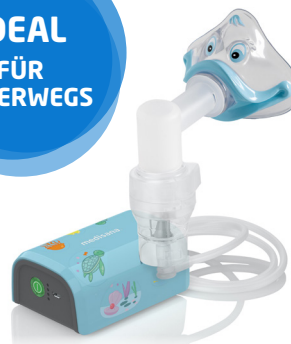
Inhalator IN 165