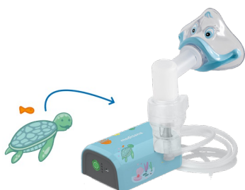
Inklusive Sticker - Set