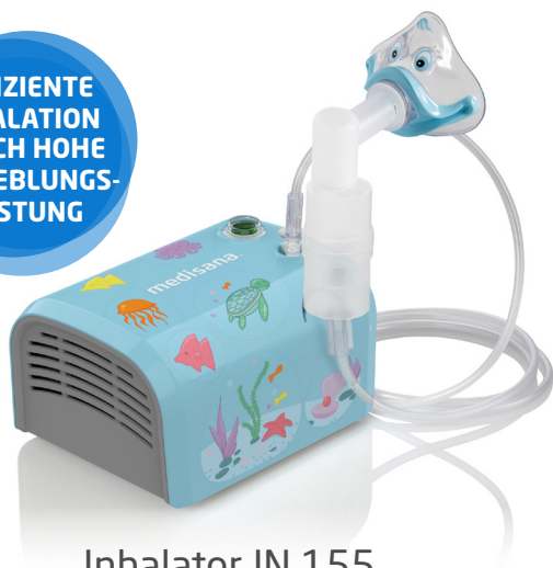
Inhalator IN 155

EFFIZIENTE INHALATION DURCH HOHE VERNEBLUNGS- LEISTUNG