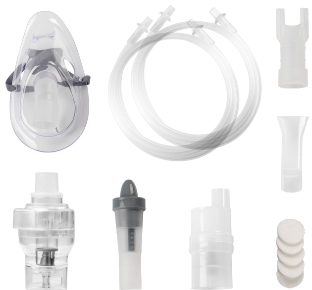
Nasendusche nur bei IN 155