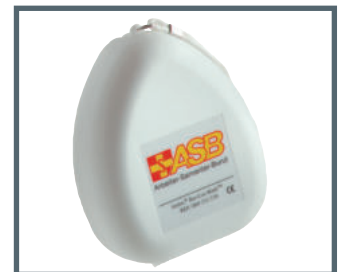
Ambu ResCue Taschenmaske Private Label

Ambu A/S Baltorpbakken 13 DK - 2750 Ballerup Denmark Tel. +45 7225 2000 Fax +45 7225 2053 www.ambu.com